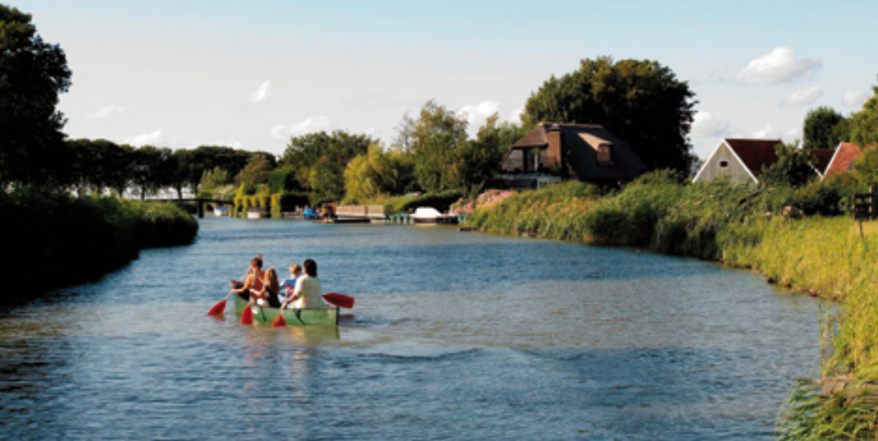
Laag Holland is bijzonder waterrijk en wordt jaarlijks bezocht door vele duizenden recreanten

land zal ongetwijfeld slinken – de mate waarin zal worden bepaald door het politieke krachtenspel in de komende jaren.