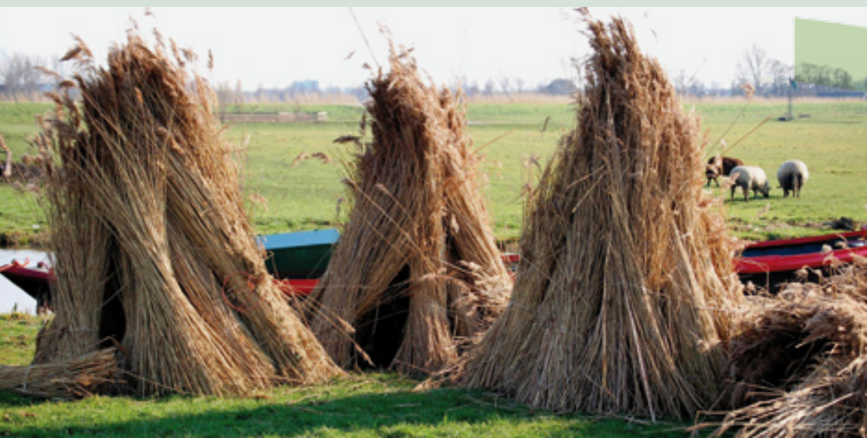
Gras, riet en extensieve veehouderij zorgen voor een fraai landschap met hoge natuurwaarden

De grondgebruikers in Laag Holland produceren in ruime mate de maatschappelijke diensten waarvan in de Houtskoolschets sprake is: een waardevol (deels Middeleeuws) landschap, een rijke cultuurhistorie, nationaal en internationaal belangrijke natuurwaarden en een gemakkelijke toegankelijkheid. De Nederlandse veenweidegebieden waarvan die in Laag Holland onderdeel zijn, behoren tot de internationaal zeldzame landschappen waarin op veel plekken de ontginningsgeschiedenis nog ongeschonden is af te lezen. Ze hebben zelfs op de nominatie gestaan om te worden aangemeld voor de Werelderfgoedlijst van de UNESCO. Dat is wel gelukt voor de Beemster, een 17 e -eeuwse droogmakerij met een heel ander karakter