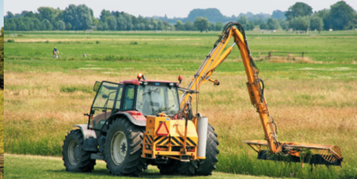
Een vooralsnog onbetaalde groene dienst: natuurvriendelijk slootshonen met de maaiorfen

schoots aan de criteria voor toekomstige betalingen zoals de Houtskoolschets die formuleert.