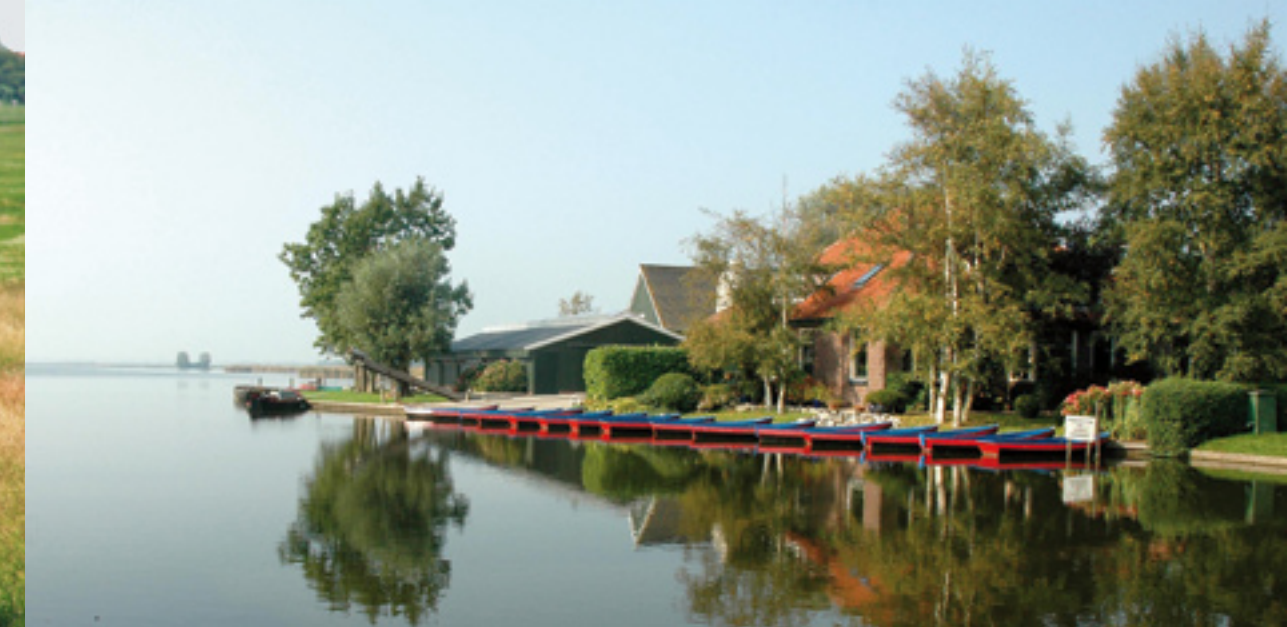
Neveninkomsten uit de markt, zoals bootverhuur, zijn slechts voor een deel van de bedrijven weggelegd