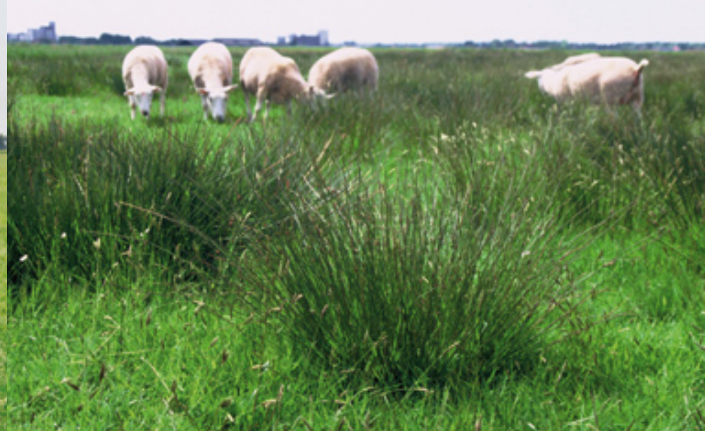
Bij onvoldoende beheer groeit het landschap plaatselijk dicht met riet en pitrus