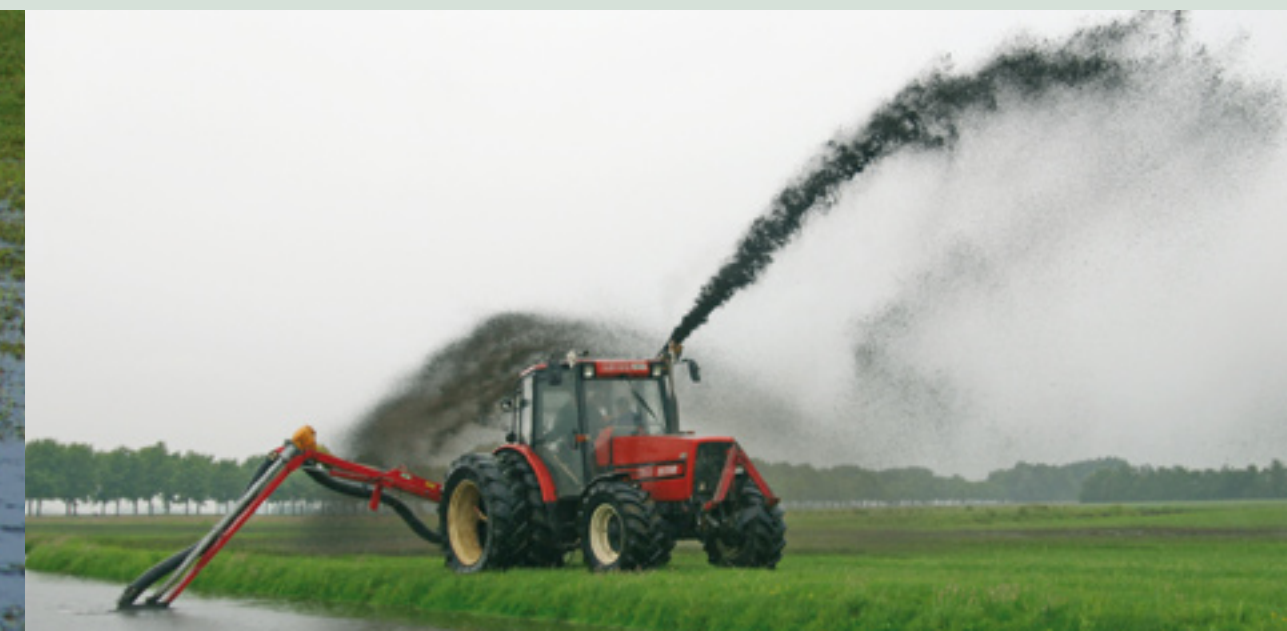
Een blauwe dienst in opkomst: baggerspuiten verbetert de waterkwaliteit en bemest het land

Een betalingsstelsel met bedragen in de genoemde orde van grootte (incl. basispremie) zou in Laag Holland leiden tot bijna een verdubbeling van het huidige bedrag aan EU-betalingen: van € 10 naar 19 mln., waarvan ruim € 12 mln. aan landschapspremies sec. Op landelijk niveau zou zo’n systeem ongeveer € 565 mln. gaan kosten, waarvan € 182 mln. aan landschapspremies sec. Dat laatste bedrag kan voor een belangrijk deel al bijeen worden gebracht door de mogelijkheden voor regionalisering die het EU-beleid nu al biedt. Daarvoor moet Nederland wel eerst overstappen van een historisch toeslagenmo-