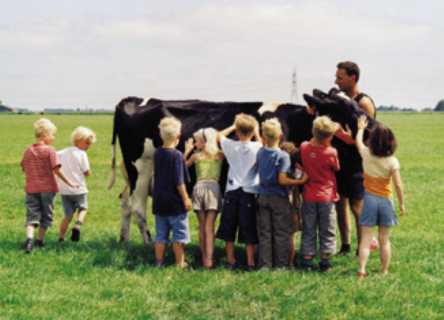
De ligging temidden van steden biedt goede kansen voor boerderijeducatie