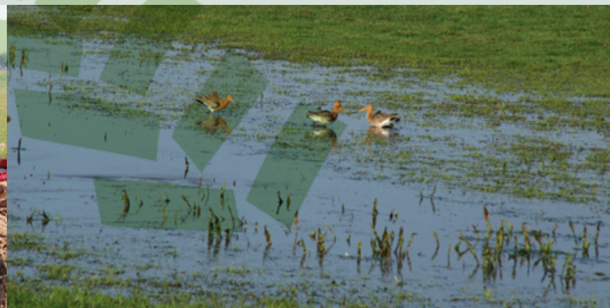
Plas-dras, een voorbeeld van betaald natuurbeheer, biedt weidevogels voedsel en rust

Het mooist zou zijn als er tegen die tijd kan worden betaald voor een nieuw type product zonder daarbij een koppeling te leggen met inkomensderving in de primaire productie, zodat er ook werkelijk kan worden verdiend aan natuur- en landschapbeheer. Nu leggen de EU en de WTO hier nog belangrijke beperkingen op.